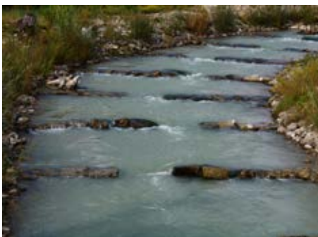
Beispiel für eine Fischtreppe

Die Fischaufstiegsanlage besteht nach der Baumaßnahme aus einem naturnahen Raugerinne mit insgesamt 14 Becken und integrierten Natursteinriegeln. Die Riegel stauen das Wasser auf, dazwischen entstehen Becken mit ruhigerem Wasserstrom. Auch junge Fische und Arten, die mit starken Strömungen nicht so gut zurechtkommen, können so selbstständig von Bucht zu Bucht flussaufwärts wandern. ■