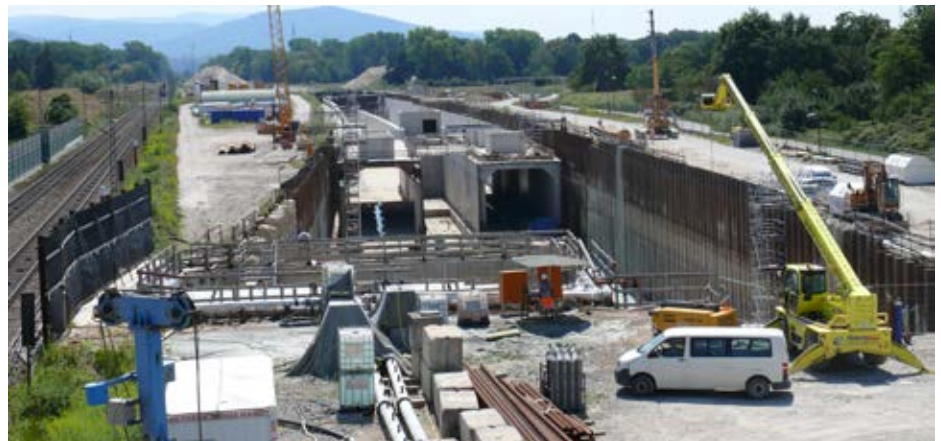
Viel los auf den Tunnelbaustellen in Ötigheim und Niederbühl.

Am 12. August 2017 senkten sich die Gleise der Rheintalbahn bei Niederbühl ab. Tag und Nacht wurde daran gearbeitet, den Schaden zu beheben. Der Betrieb auf der Rheintalbahn konnte schließlich am 2. Oktober 2017 wieder aufgenommen werden. Auch die Bauarbeiten am Tunnel Rastatt konnten weitergehen, die Schadensursache wird weiterhin untersucht.