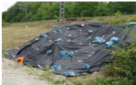
Die gemähte Fläche wird mit Folie ausgelegt.

Seit September 2018 führt die Bahn außerdem vorgezogene Ausgleichsmaßnahmen zum Schutz verschiedener Vogelarten durch. Bei Auggen und Müllheim wird auf einer Fläche von rund 5,2 Hektar artenreiches